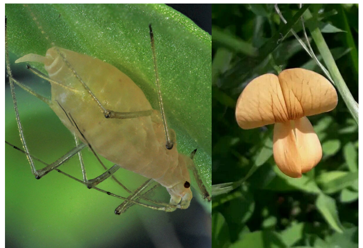
Figure 4 : Photo du puceron du pois Acyrtosiphon pisum (à gauche) et d'un apparenté sauvage du pois pisum fulvum (à droite)

Les régions du génome impliquées dans la résistance seront cartographiées par une approche d'analyse de liaison. Le spectre d'efficacité des résistances des meilleures lignées F6 sera évalué sur des populations du puceron A. pisum disponibles au sein du laboratoire. Ce projet participera à la transition vers une agriculture plus durable et diminuant les traitements pesticides. Il offrira des pistes tangibles pour améliorer génétiquement le pois qui est une espèce protéagineuse majeure pour la transition agroécologique.