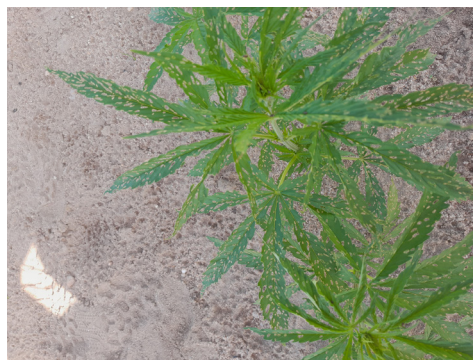
Figure 2 : Jeunes plants de chanvre attaqués par l'altise

par ces QTL permettront la construction de ressources génétiques chez le chanvre, et l'acquisition de connaissances sur les mécanismes de l'interaction plante-insecte. Ce projet permettra l'identification de nouvelles sources de résistance qui pourront être utilisées chez d'autres espèces de plantes.