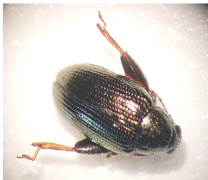
Figure 1 : Altise

Suite à ces travaux, les équipes de recherche étudieront les gènes candidats des voies métaboliques identifiées et entameront un travail de sélection assisté par marqueurs sur les zones du génome associées. Ainsi, elles seront en mesure de faire une sélection ciblée pour créer des variétés résistantes ou tolérantes aux altises, ou à l'inverse des variétés « pièges à altise » qui pourront être utilisées en mélange ou intercalées à la culture de production. L'utilisation des métabolites secondaires détectés comme source de produits de biocontrôle sera étudiée.